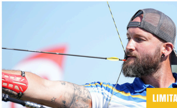
LIMITATION CÔTÉ CORDE