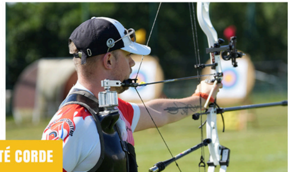
Tir à l'aide d'un outil mécanique appelé "décocheur"