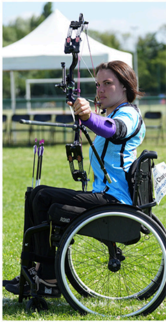
Pas d'adaptation particulière