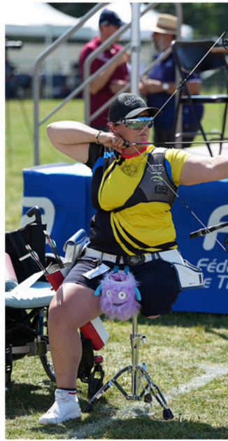
Si manque d'équilibre : assise