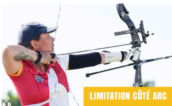
LIMITATION CÔTÉ ARC