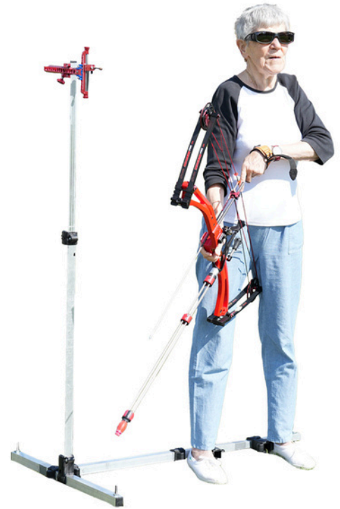
Une polence pour aider le para-archer à se placer et viser